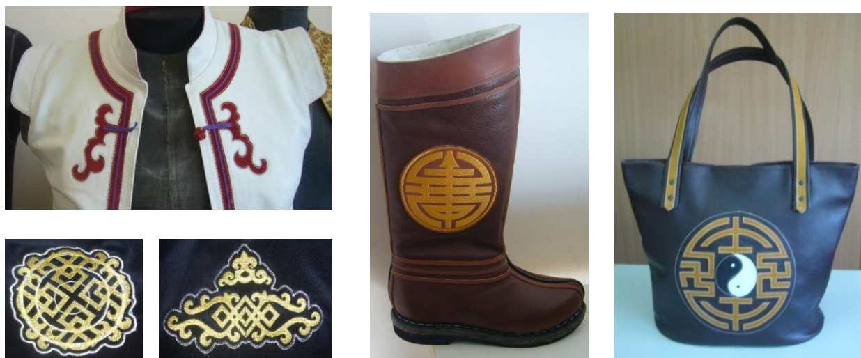
Рисунок 5 – Орнамент в изделиях индустрии моды. Работы МИП «Гутал»

Среди рельефных изображений орнамента можно отметить тиснение на коже и аппликативные узоры в сувенирных видах продукции, в декоративной отделке рукавиц и бурятской традиционной обуви – унт, в кожгалантерейных изделиях [2;243; 3;85; 4;77; 5;56], различные скульптурные рельефные изображения малых архитектурных форм на улицах города.