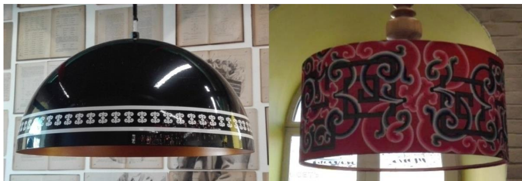
Рисунок 4 – Современные абажуры с этническими мотивами в интерьере кафе.

В практическом использовании народного орнамента можно также выделить следующий аспект. Очевидно, что в различных отраслях дизайна может использоваться как плоскостное, так и рельефное и объемное изображения орнамента. К плоскостным изображениям в графическом дизайне можно отнести разнообразную печатную и рекламную продукцию с элементами орнаментальных узоров, в прикладном искусстве костюма – это напечатанные, вышитые, вырезанные и другие орнаменты в виде узоров на материалах для одежды, обуви, сувенирной продукции и орнаментальные мотивы, выполненные на уже готовых изделиях в соответствии с их композицией.