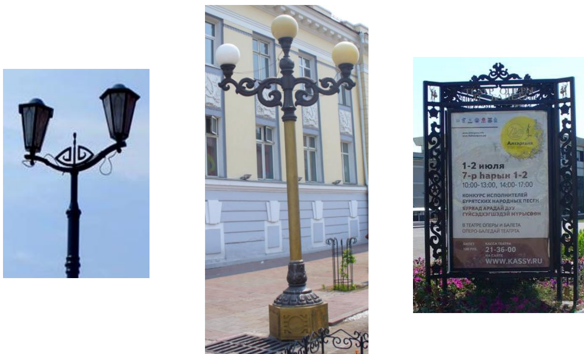
Рисунок 1 – Орнамент в оформлении улиц г. Улан-Удэ

Для использования орнаментальных форм народной бурятской культуры в современном дизайн-проектировании необходимо выделить наиболее востребованные в рамках общей классификации его виды. Среди орнаментов бурятского этноса можно выделить следующие: геометрические, зооморфные орнаменты, космологические и флористические мотивы, культовые буддийские символы [6;25]. Если в композиции малых архитектурных форм города Улан-Удэ наиболее распространены геометрические и зооморфные, реже космогонические орнаменты [1;12] (рисунок 1), то в формотворчестве предметов прикладного искусства, в частности современного костюма, используются почти все указанные орнаментальные формы. Например, в оформлении улиц и площадей города отмечены такие орнаменты, как широко распространённые «меандр», роговидный орнамент, так называемый узел счастья «улзы» [6;29].