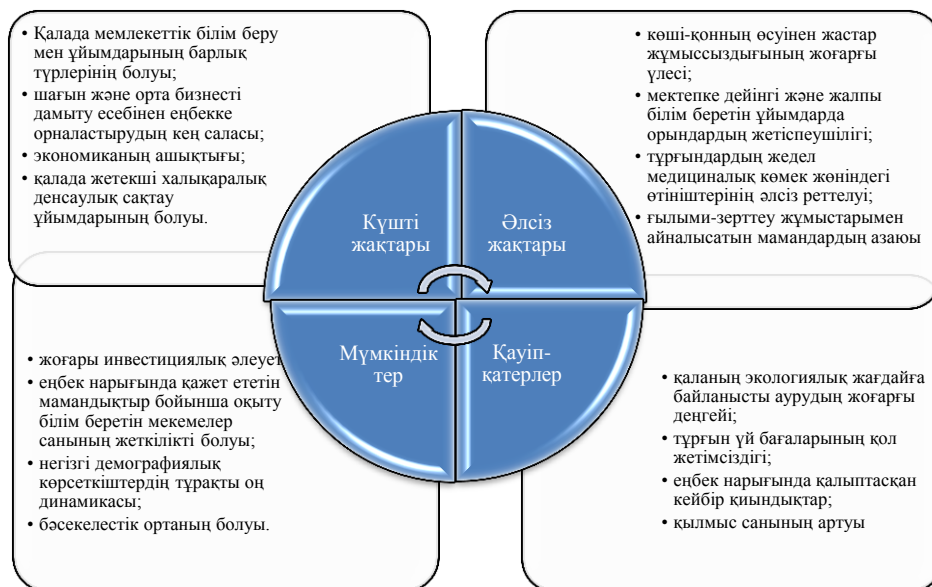
Сурет 1 – Алматы қаласы халқының өмір сүруіне әсер етуші факторларға SWOT-талдау (автордың құрастыруымен)

Алматы қаласы дамуының әлсіз жақтары мен даму мүмкіндіктерін анықтай келе, халқының өмір сүруіне әсер етуші проблемаларды төмендегі SWOT-талдау ретінде көрсеттік.