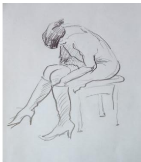
3 - курс студенті Мұсатай Ш.