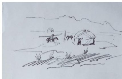
Эскиз. 3 - курс студенті С.Нұрғалиева