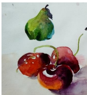
Этюд. 3 - курс студенті Г.Икрамжанова